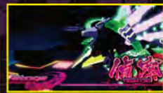
偵察ステージスタート!