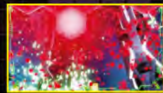
赤ステージチェンジ