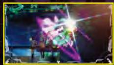
ミニアルティール出現!