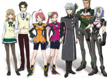
ミナト シマ メイウー メイエン ルーシェン クリス アーク