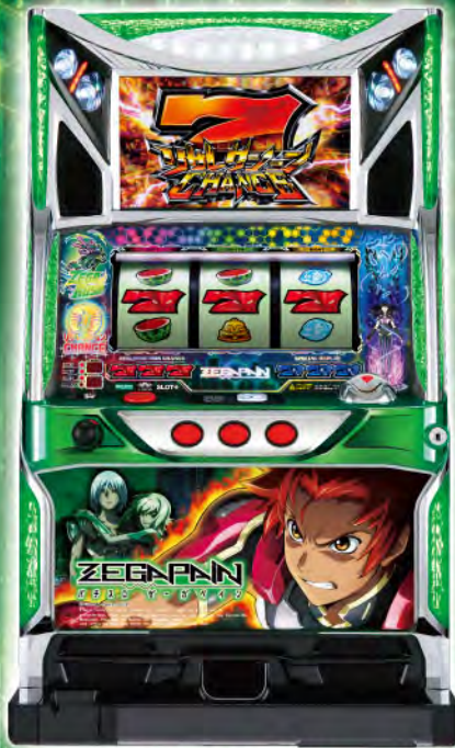
パチスロ ゼーガベイン