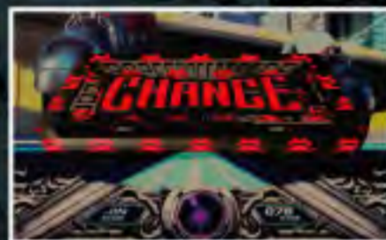
ドットカエル出現!