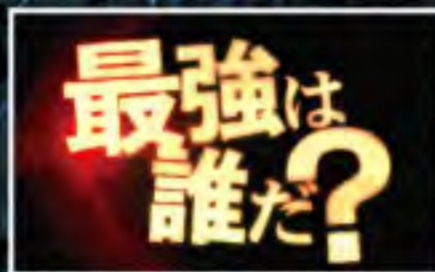
ムービー予告発生!