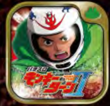
パチスロ モンキーターンII