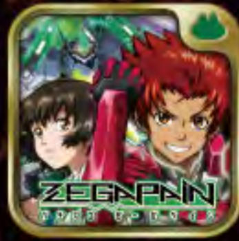
パチスロ ゼーガピン