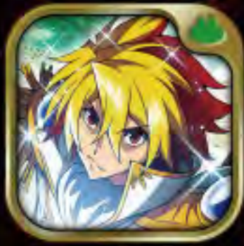
パチスロ スタードライバー