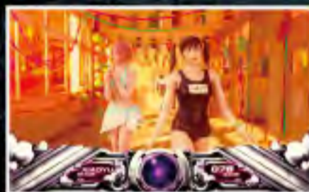
コスチュームが変化!