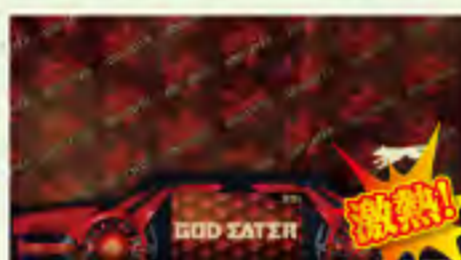
ゴッドイーター柄出現!