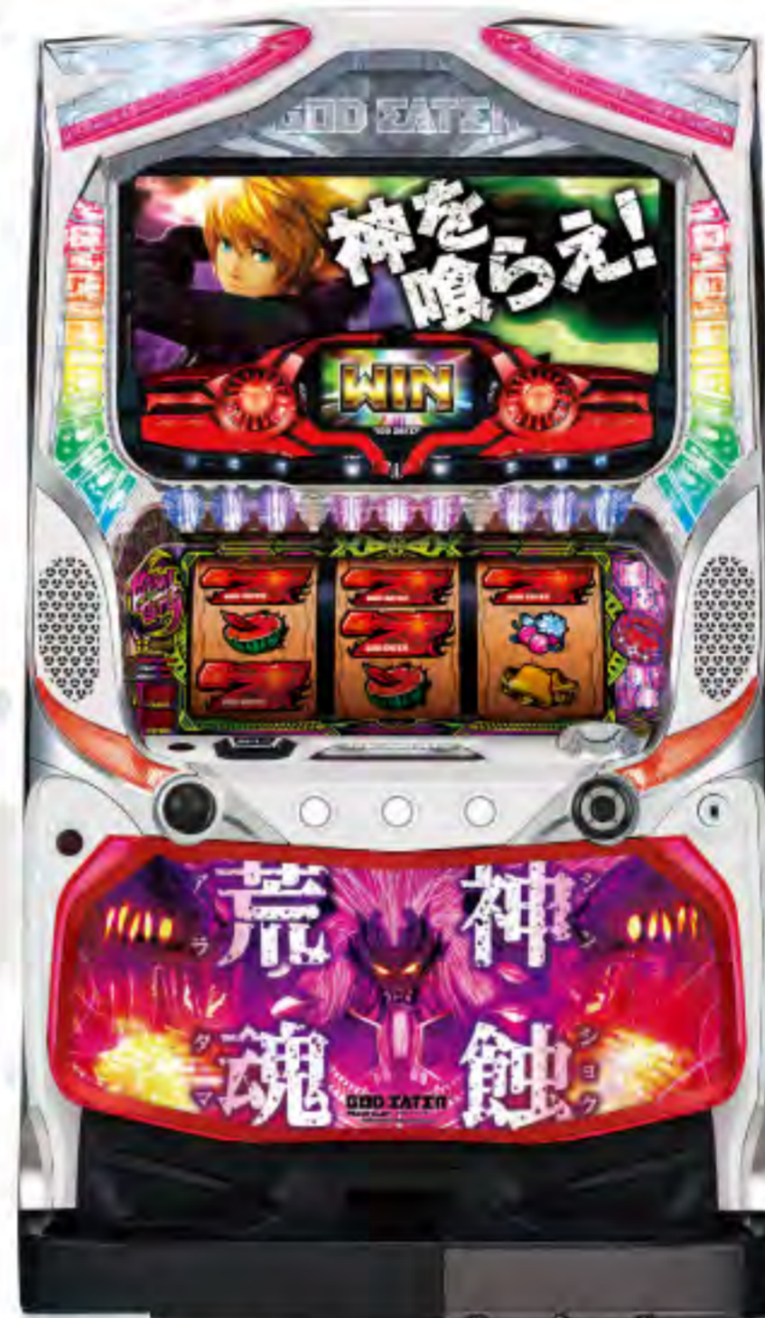
パチスロ ゴッドイーター 荒神Ver.