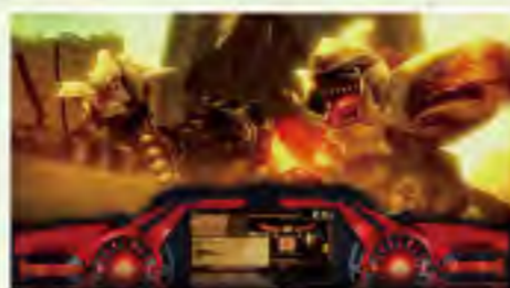
アラガミの気配が!?