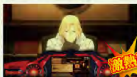
シックザール登場!