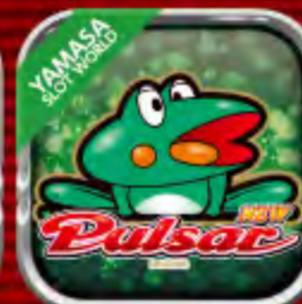
ニューパルサーデラックス