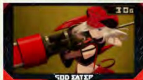
ステップアップするほど!