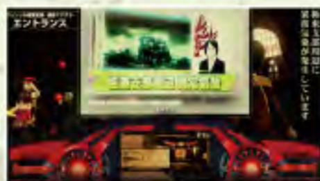
異常気象ニュース頻発!