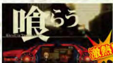
キャッチコピー出現!