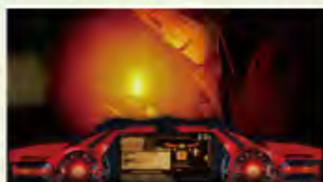
リンドウがタバコに火を!